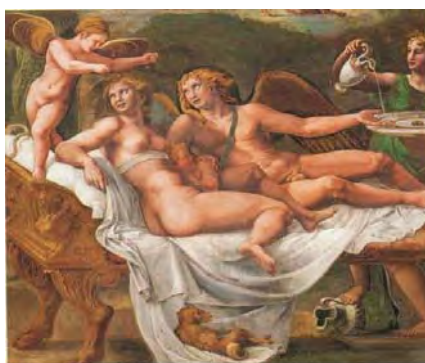
Giulio Romano e suoi - Sala di Psiche. Banchetto nuziale - Palazzo Te, Mantova

19 Febbraio 2016, ore 20,45 presso la Sala Norlenghi, Corso Vittorio Emanuele- Mantova